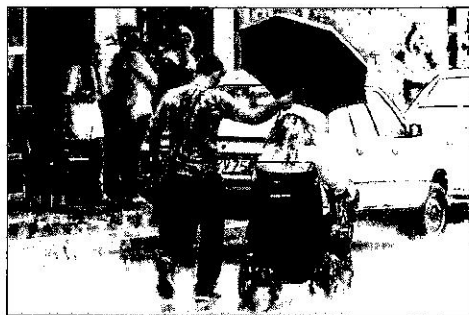
An act of kindness

I Many people believe that helping others is good for our health. Research shows that this is true. For example, some studies have found that people who spend money on others have fewer heart problems. Other research shows that people who do volunteer work feel happier. But can we also benefit from watching others do an act of kindness? Research that was published recently studied this question.