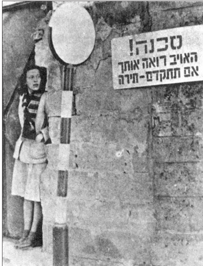
(הרמן, ל' [עורכת]. [1983]. תולדות עם ישראל בדורות האחרונים. יחידה 11. תל אביב: האוניברסיטה הפתוחה, עמ' 14)