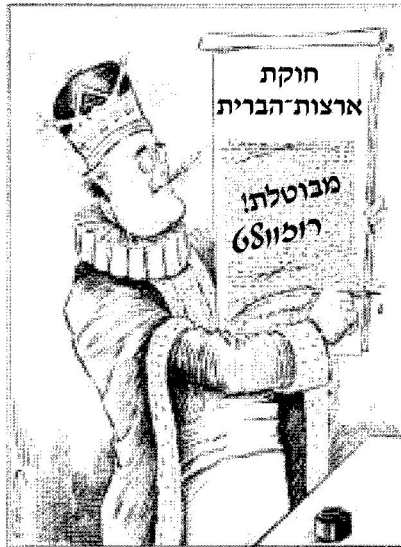
"המלך אינו יכול לטעות"

תמונה 1 – צייר: גריוס, מן האתר: www.princeton.edu/pr/pictures/-r/political_cartoon_exhibition/