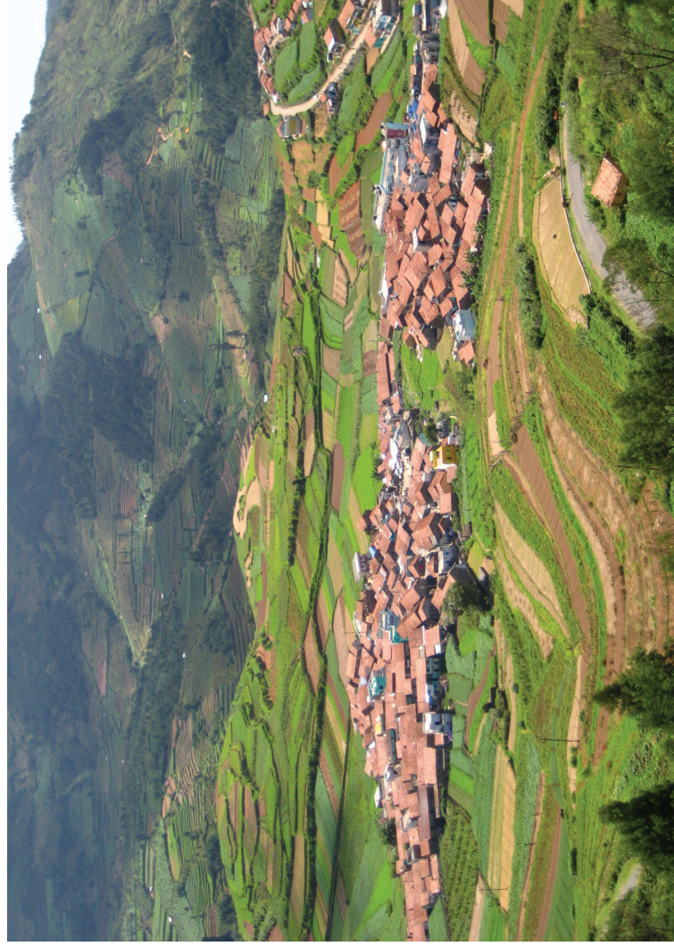
צלילום: Parthan تصوير: