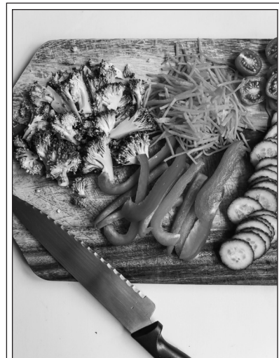
Sliced Vegetables

III Scientists also found that children who eat vegetables every day continue to include vegetables in their diets, even when they are adults. And these adults who eat vegetables have better health and 15 more active brains. So, healthy eating habits that we learn in childhood stay with us and are important later in life, too.