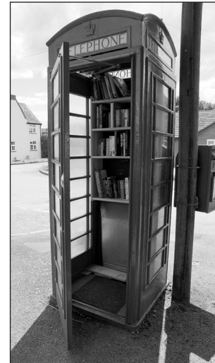
A phone box library