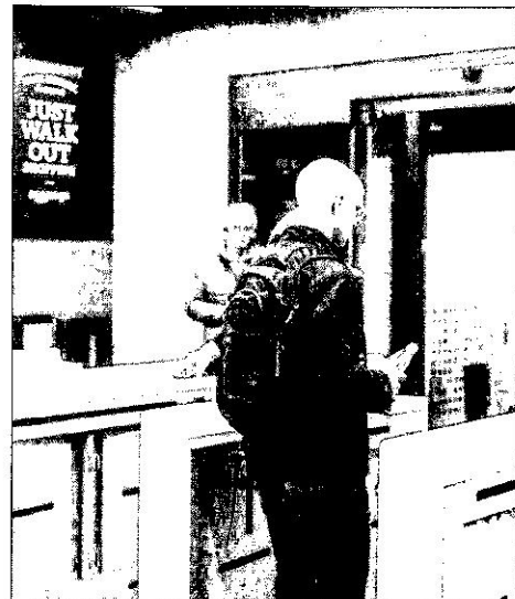
A man leaving the store

V How does Amazon plan to use this technology in the future? They don't say. However, for now, shoppers at Amazon Go should be careful. Without cashiers at the exit, it's easy to spend too much.