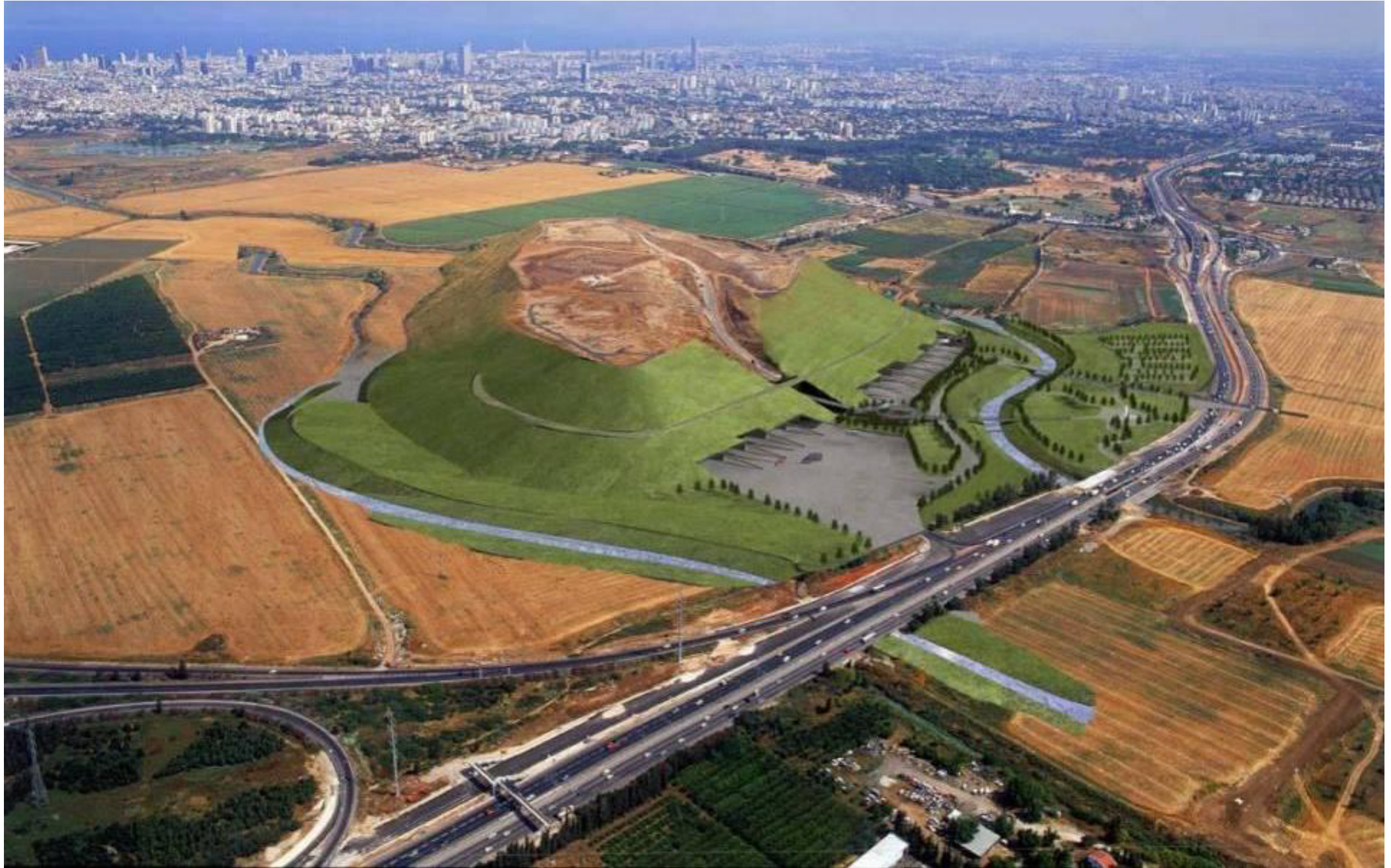
תמונה 2 – פארק איילון, תחזית לעתיד الصورة 2 – پارک أیلون، توقع مستقبلی