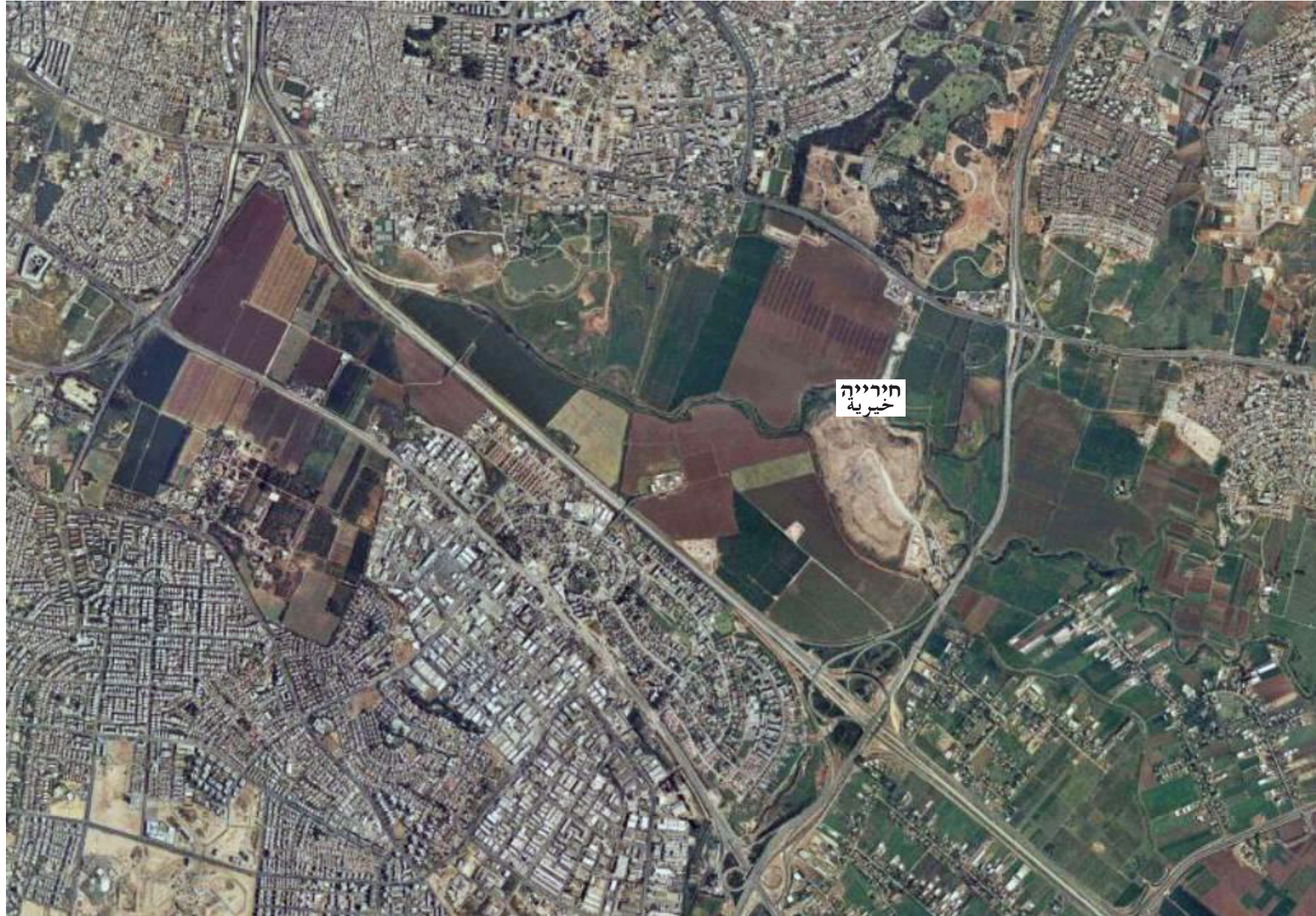
תמונה 1 – אתר סילוק הפסולת חירייה כיום الصورة 1 – موقع النفايات خيرية اليوم